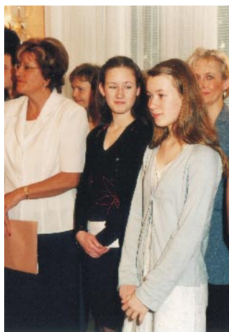
Sestry Hemsingovy při slavnostním přijetí na radnici.

Vyhlašovatel a titulární sponzor soutěže Advertiser and titular sponsor of the Competition