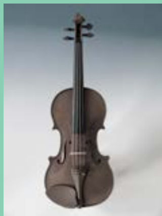
DRAČÍ HOUSLE. CENA PRO LETOŠNÍ LAURÉÁTA