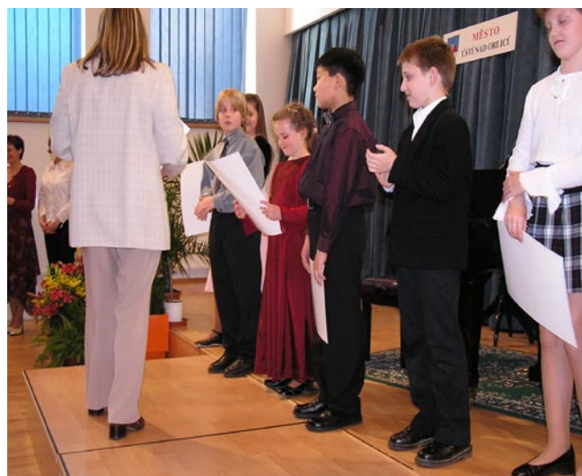
Chvilka z vyhlášení 1. kategorie