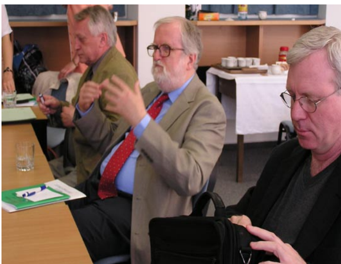
Porota: vše je rozhodnuto