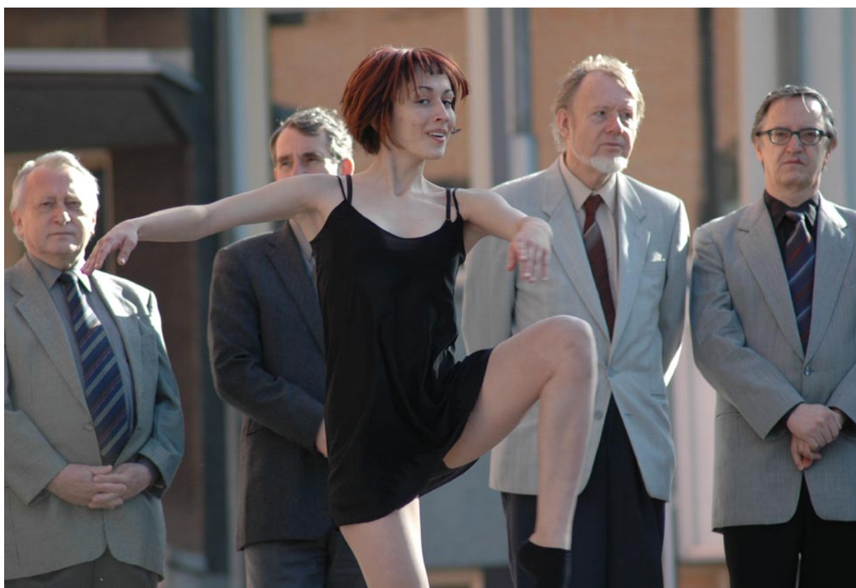
Zahájení 46. ročníku KHS.