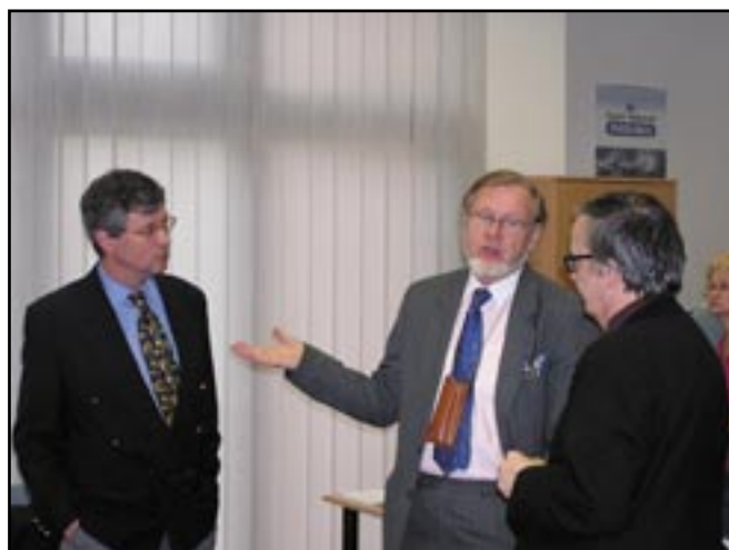
Pracovní porada poroty