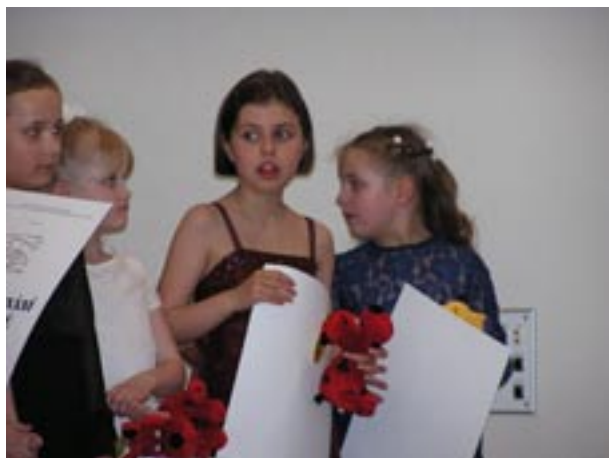
I. kategorie - vše je rozhodnuto