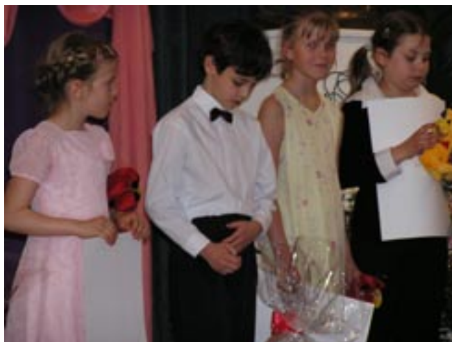
Chvilice napětí při vyhlášení výsledků

- v tuto chvíli si uvědomuji, že spolupracuji již na „svém“ devatenáctém ročníku soutěže! První laureát, kterého jsem v Ústí nad Orlicí potkal, byl tehdy v roce 1986 Pavel Šporcl. mn