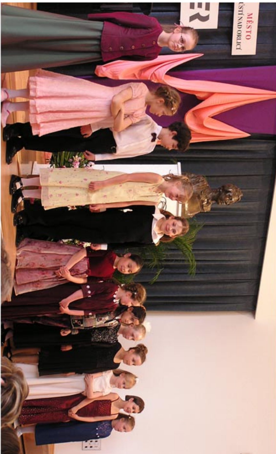
Vyhlášení výsledků I. kategorie Kocianovy houslové soutěže 2005