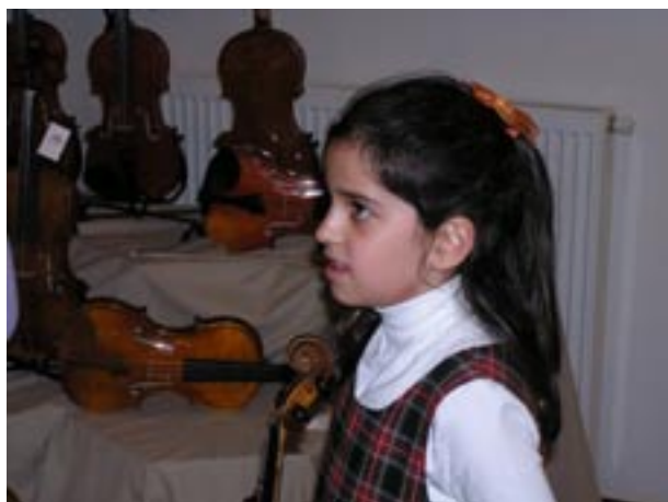
Před výstavkou houslí firmy Akord Kvint