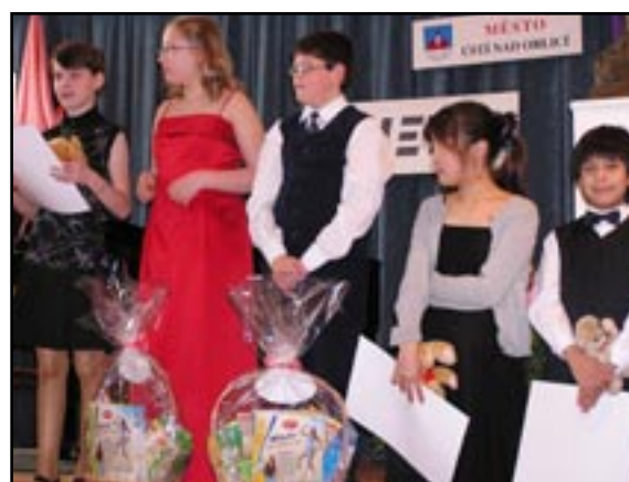
II. kategorie - vše je rozhodnuto