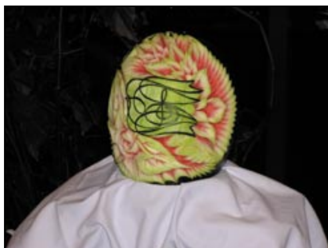
Umělecky zpracovaný meloun s emblémem KHS k vidění v 1. patře ZUŠ