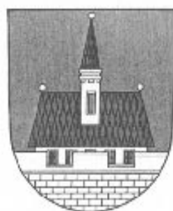
Město Ústí nad Orlicí