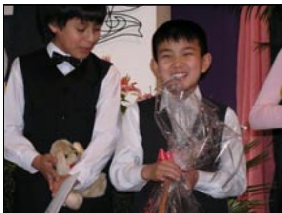
Na tvářích zahraničních účastníků je vidět radost