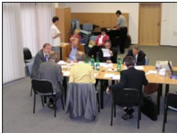
V popředí porota, v pozadí organizátoři připravují diplomy