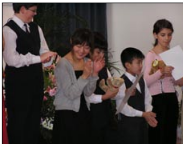
Vyhlášení výsledků II. kategorie - radujeme se !